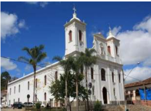
Figura 3 – Igreja Matriz

2º dia – 21 Agosto – sexta-feira (C/A/J): Após café da manhã, continuação pelo centro histórico, visitaremos a Igreja N. Sra. do Rosário , ao Atelier Benito Campos , renomado artista plástico e uma das figuras mais importantes da identidade cultural da cidade, o Museu Enkukakuba , espaço cultural dedicado ao folclore, teatro de bonecos, contação de histórias e preservação das tradições caipiras, a Igreja Matriz . No período da tarde visita a Destilaria Mato Dentro , produção de cachaça artesanal refinada que une a força da Serra do Mar ao terroir do Vale do Paraíba e, por fim, a Fazenda São Luiz , do século XVIII conta com um pequeno acervo da história e cultura da região do vale do Paraíba paulista. Noite de pizza para o grupo na Pousada Asa de Vento.