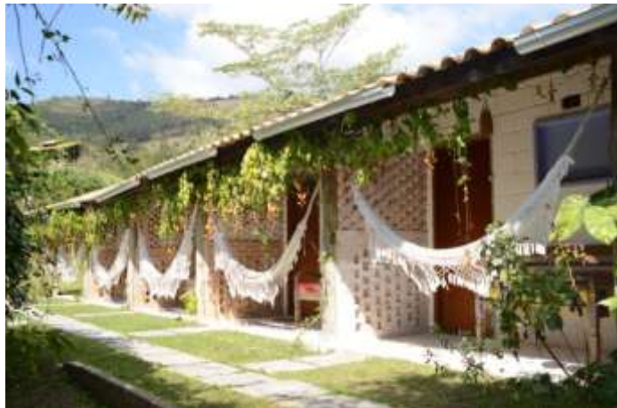
Figura 6 – Refúgio das 7 Cachoeiras

4º dia – 23 Agosto – domingo (C): Check-out e antes de partirmos para São Paulo, pararemos na fábrica e loja de queijos Bufalat , especializada na produção de queijos de búfala com raízes italianas e uma das melhores do mercado. Chegada em São Paulo no período da tarde.