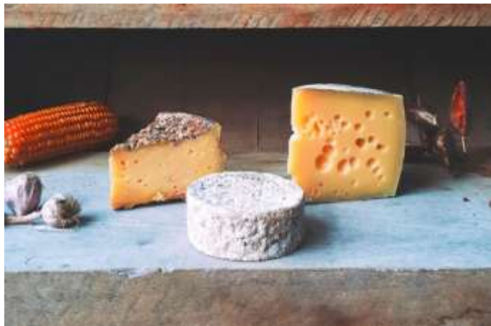
Figura 5 – Fazenda de Queijos Lano Alto

3º dia – 22 Agosto – sábado (C/A/J): Check-out hotel e saída para o bairro de Catuçaba próximo a São Luiz do Paraitinga para visita à Fazenda de Queijos Lano Alto no alto da Serra do Mar. Uma fazenda com produção de queijos e iogurtes de leite cru certificado do próprio rebanho de vacas Jersey de altíssimo nível de qualidade. Check-in no Refúgio das 7 Cachoeiras , proposta de imersão na natureza que combina hospedagem e gastronomia de fazenda, acesso privado a múltiplas quedas d'água dentro da propriedade. Almoço e jantar incluídos.