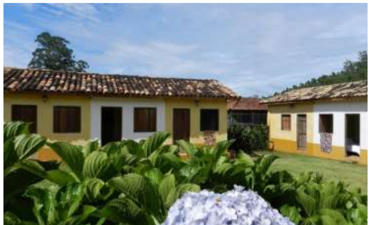
Figura 4 – Fazenda São Luiz