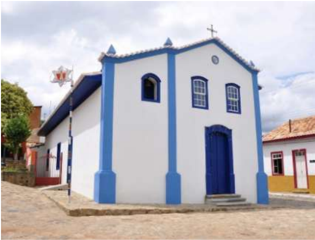
Figura 1 - Capela Nossa Senhora das Mercês

1º dia – 20 Agosto – quinta-feira (A/J): Saída de São Paulo às 8h com destino à São Luiz do Paraitinga, chegada para almoço. À tarde city tour pelo centro histórico percorrendo os principais pontos históricos e arquitetônicos como; a Capela Nossa Senhora das Mercês , os casarões tombados pelo patrimônio histórico e arquitetônico tais como a Casa Oswaldo Cruz construída em 1835, museu dedicado a história do cientista luizense e também destaca tradições locais, como o folclore, as festividades populares e a religiosidade, o Mercado Municipal restaurado recentemente, o Instituto Elpídio dos Santos , espaço que conserva o patrimônio histórico musical da região do Vale do Paraíba. Check-in na pousada por volta das 17h e jantar na cidade.