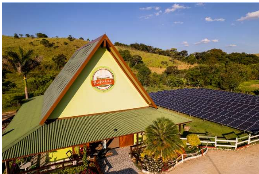
Figura 7 – Fábrica e Loja de Queijos Bufalat

4º dia – 23 Agosto – domingo (C): Check-out e antes de partirmos para São Paulo, pararemos na fábrica e loja de queijos Bufalat , especializada na produção de queijos de búfala com raízes italianas e uma das melhores do mercado. Chegada em São Paulo no período da tarde.