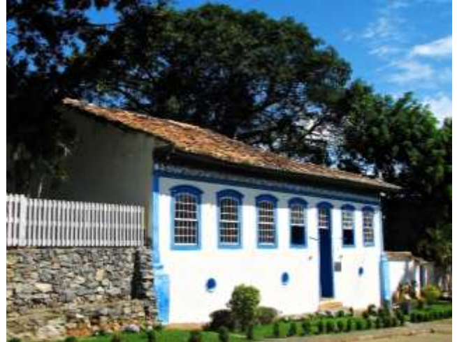
Figura 2 - Casa Oswaldo Cruz